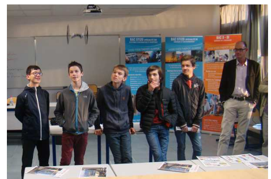
Le vol du drone