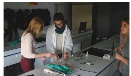
Les « Expertes » !