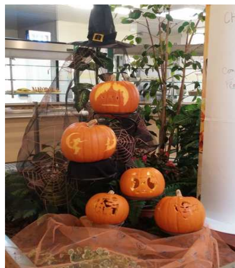
Décor d'Halloween au self